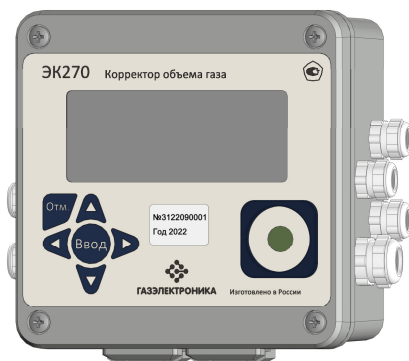
Рисунок 1 – Общий вид корректора объема газа ЭК270